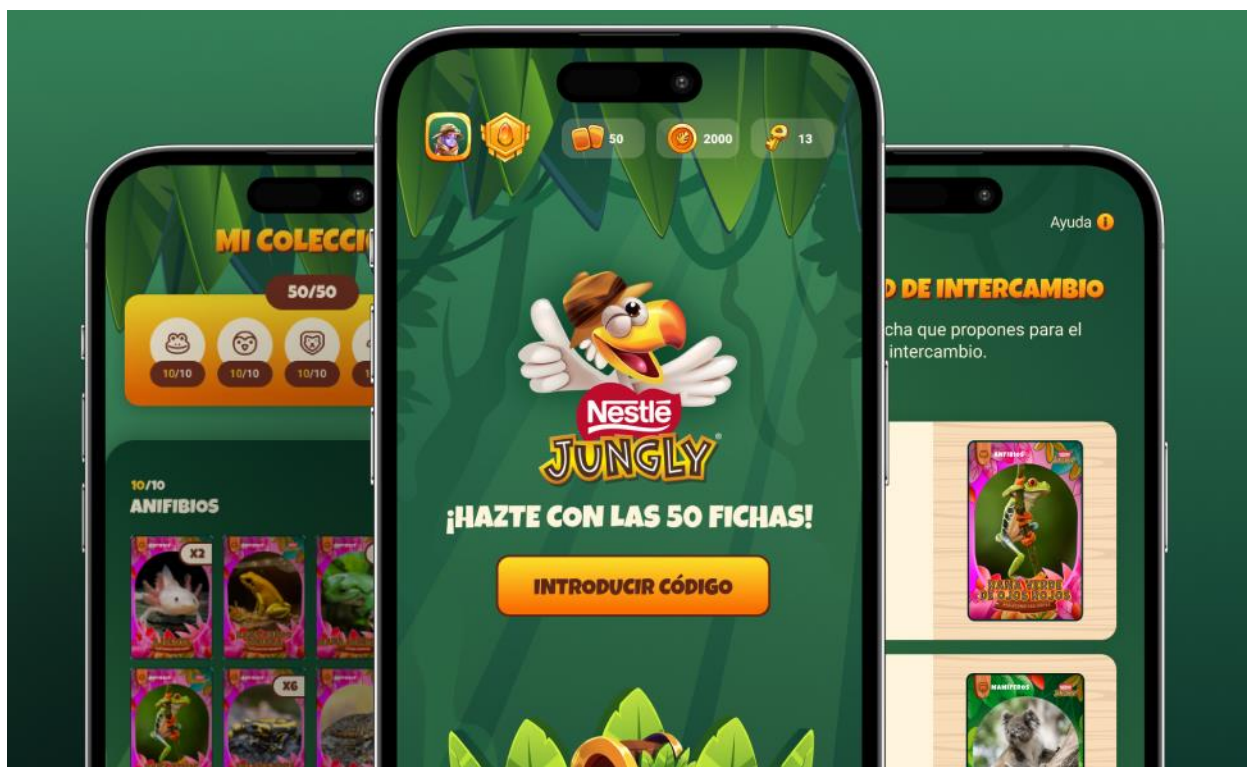
App de Nestlé Jungly donde se pueden coleccionar e intercambiar las 50 fichas digitales con fotos de animales.